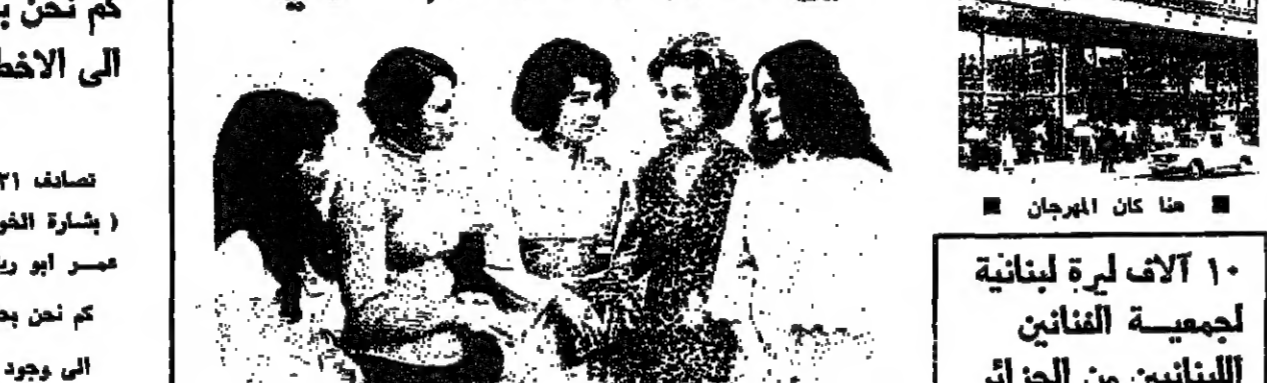
هنا كان المهرجان